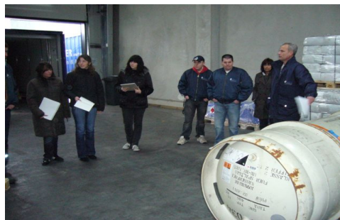
wie wird Sperrigkeit berechnet ? – Beispiele vor Ort

Bei der internen Schulung am 10.2.2009 für die Auszubildenden von KIRCHNER und Partner wurden u.a. folgende Themen behandelt: - Kostenbezogene Vor- und nachteile der LKW mit EURO 3 – EURO 4 und EURO 5, -die daraus resultierende Maut und Auswirkungen auf die Umweltzonen -Berechnung von Sperrigkeiten und Lademeter an Hand von Beispielen aus der Praxis