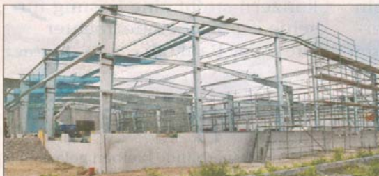
Mehr Platz für schnelleren Güterumschlag schafft sich derzeit das Gernsheimer Logistikunternehmen Kirchner.

Der Logistikdienstleister Kirchner und Partner GmbH baut den Stammsitz Gernsheim weiter aus. Derzeit entsteht dort eine neue, 1500 Quadratmeter große Um- schlaghalle mit 1500 Palettenstell- plätzen zur Reduzierung der Hand- lingkosten. Geplant sind auch eine Tankstelle und eine Waschanlage auf dem neuen Betriebshof. Die